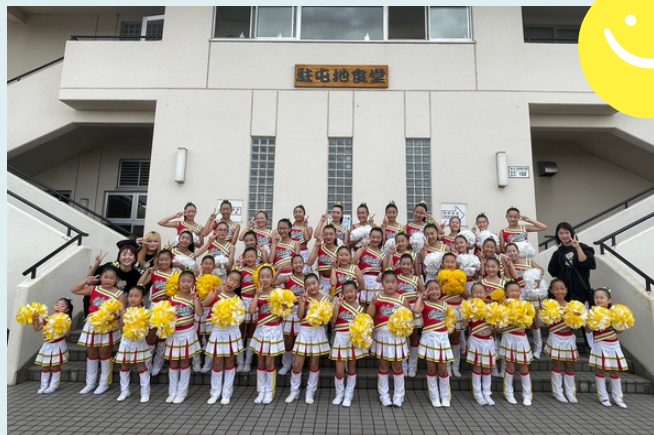
八尾市陸上自衛隊記念式典 出演