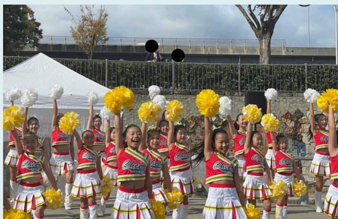
エシカルフェスタ久宝寺緑地 出演