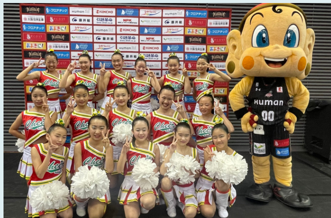
大阪エヴェッサ ハーフタイム 出演