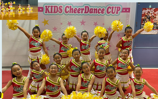
KIDS CHEERDANCE CUP 2023