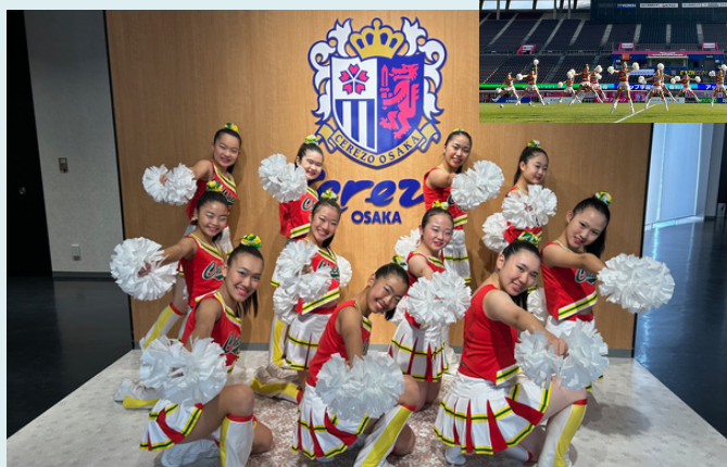
セレッソ大阪 オープニング出演